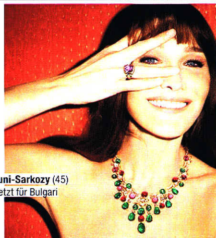
Carla Bruni-Sarkozy (45) wirbt jetzt für Bulgari